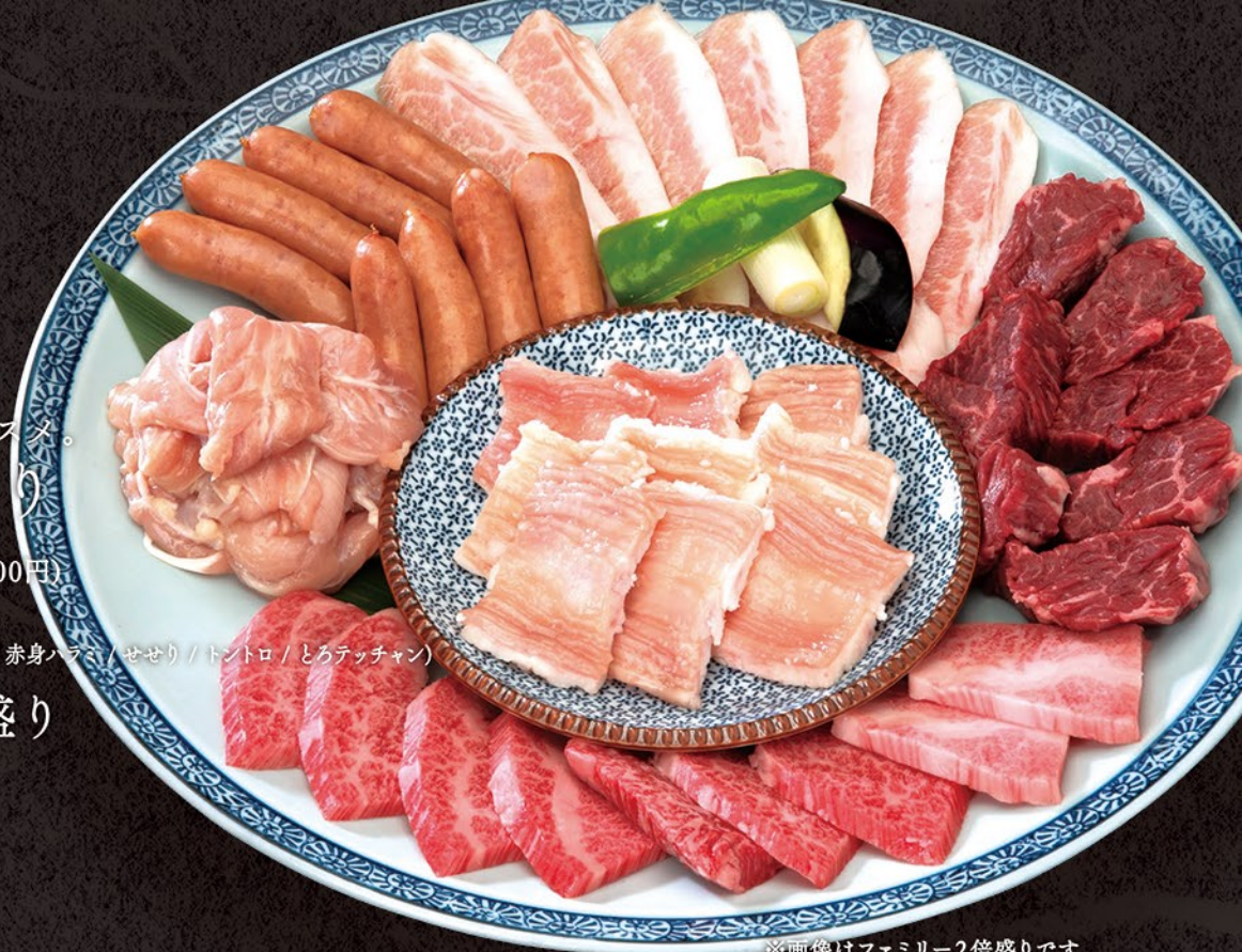
※画像はファミリー2倍盛りです。